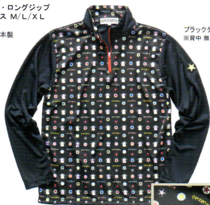
ブラックダークマルチ ※背中 無地ブラック

OPT-1151 UVカット&クール・ロングジップ メンズ・ユニセックス M/L/XL 本体¥8,400 ポリエステル100%/日本製