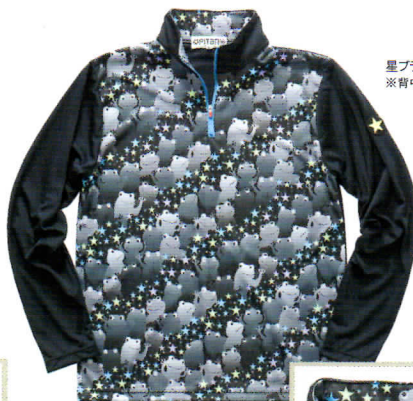
星ブラックグレー ※背中 無地ブラック