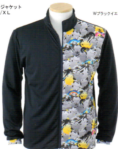
Wブラックイエロー

OPT-1281 UVカット&クール・サマージャケット メンズ・ユニセックス M/L/XL 本体¥9,800 ポリエステル100%/日本製 H28.3月末入荷予定