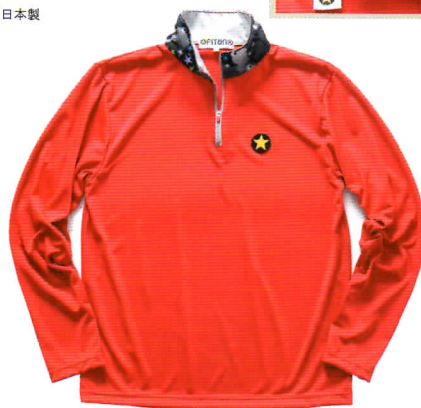
レッドxブラックグレー ※M/Lサイズのみ