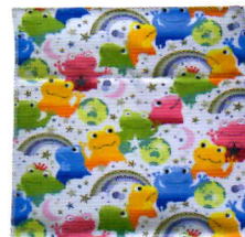
ホワイトキャンディ