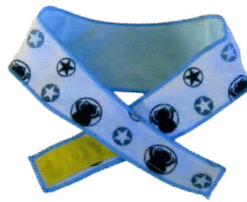
ホワイトブラック