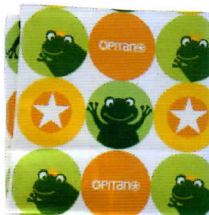
ホワイトグリーン