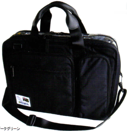
星ダークグリーン