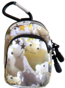
シェードベージュ