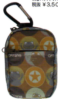
ブラウンオリーブ