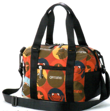
ケチャップレッド

■旅行や、スポーツのサイドバッグに、絶対オススメしたい バッグです。たっぷり入るから荷物が増えても大丈夫！ ストラップは、毛玉がでにくいのが、嬉しい機能。大切な お洋服でも、安心してナナメ掛けして下さい。