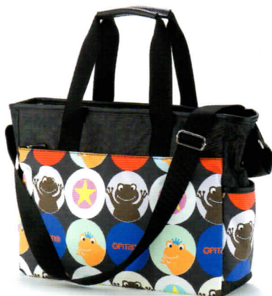
ブラックサーカス